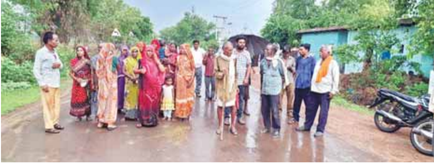
हरिभूमि न्यूज ▶▶ दमोह