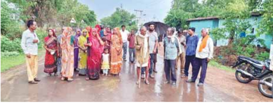
हरिभूमि न्यूज ▶▶ नरसिंहगढ़

जिले के ग्राम कल्याणपुरा और रानगिर के ग्रामीणों ने अपनी पुश्तैनी काबिज जमीन बचाने को लेकर कलेक्टर को एक ज्ञापन सौंपा है। ग्रामीणों ने आरोप लगाया है कि गौशाला निर्माण की प्रक्रिया के चलते उनकी 50-60 वर्षों से काबिज सरकारी भूमि छीनी जा रही है, जो उनके जीवन यापन का एकमात्र साधन है। ग्रामीणों ने ज्ञापन में बताया कि उनके पास कोई वैकल्पिक जमीन या आय का स्रोत नहीं है। उन्होंने बताया कि यह भूमि उबड़-खाबड़ थी, जिसे वर्षों की मेहनत और लागत से खेती योग्य बनाया गया है। अब प्रशासन द्वारा इस जमीन पर गौशाला बनाए जाने की जानकारी से वे चिंतित और आक्रोशित हैं। महिलाओं समेत बड़ी संख्या में ग्रामीणों ने कलेक्टर से मांग की है कि जहां-जहां अन्य सरकारी भूमि उपलब्ध है, वहां गौशाला बनाई जाए। उनका कहना