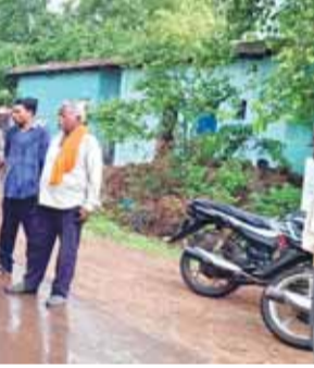
हरिभूमि न्यूज ▶▶ दमोह