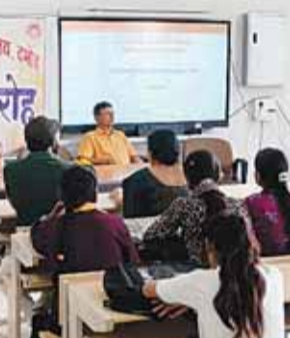
हरिभूमि न्यूज ▶▶ दमोह