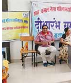
हरिभूमि न्यूज ▶▶ दमोह